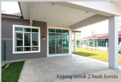
Anjung untuk 2 buah kereta